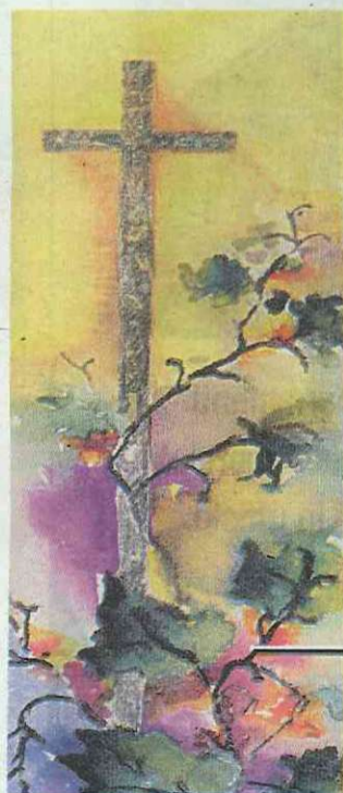
ABB POGGLIANO di Gavina & Balbo

L'Apri Onlus ha riempito la sala congressi della Biblioteca Archimede. Molti disabili visivi hanno preso parte al convegno sulla lettura agevolata e sugli ausili a disposizione dei non vedenti per non privarsi del piacere della lettura. Si è parlato di editoria a caratteri ingranditi, audio-libri, macchine per la lettura vocale, libri tattili per bambini e tanti altri strumenti che possono contribuire a non privare l'accesso alla cultura anche quando gli occhi iniziano a non funzionare bene. È stata inoltre annunciata la firma di un protocollo d'intesa fra Apri Onlus e Fondazione Ecm. Tale accordo consentirà in futuro di sviluppare iniziative e corsi rivolti all'accessibilità culturale. Fra le principali novità tecnologiche presentate vi è il nuovissimo video-ingranditore ibrido "Vocatex" della TifloSystem di Padova e la prima macchina di lettura manovrabile interamente con soli comandi vocali. La Biblioteca Archimede, rappresentata dal dott. Riccardo Ferrari, ha espresso vivo interesse verso queste problematiche.